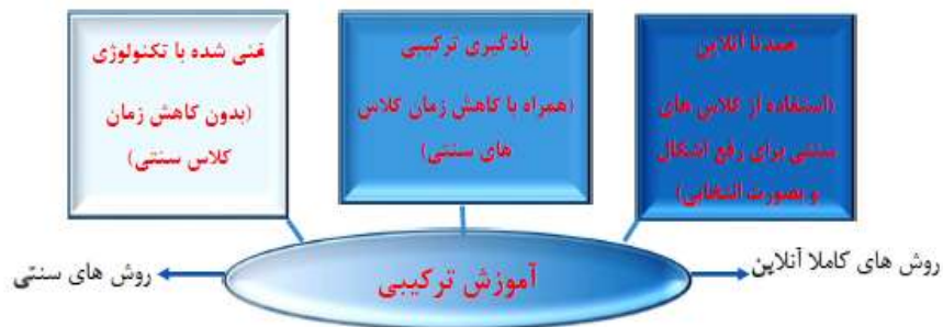
شکل شماره ۲: آموزش ترکیبی (گراهام ۶ ، وودفیلد ۷ ، هریسون ۸ ، ۲۰۱۲)

همان گونه که در شکل ۲ نشان داده شده است عناصر رویکردهای رودرو و آنلاین ممکن است به میزان کم یا زیاد، بسته به محدوده عوامل سنتی و تصمیمات آموزشی، با یکدیگر ترکیب شوند.