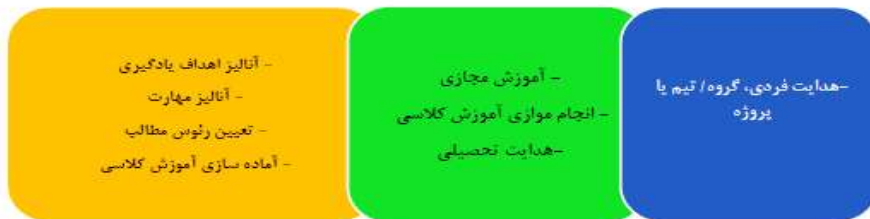
شکل شماره ۴: مراحل پیاده سازی (تراپ ۱ ، ۲۰۰۶)

تعیین دستورالعمل‌هایی که سهم و عملکرد دوره‌های آموزش ترکیبی را بر مبنای عواملی نظیر ویژگی‌های دوره تحصیلی، ویژگی‌های فردی یادگیرندگان، دسترسی به امکانات و ... مشخص می‌نماید.