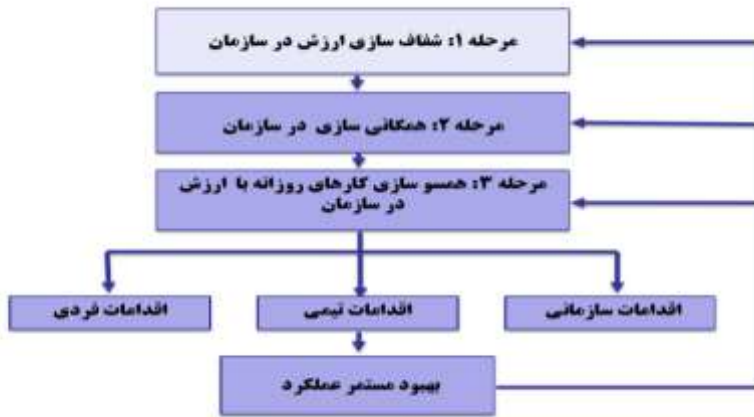
شکل شماره ۱: گام های مدیریت ارزش (به نقل از بلانچارد و اوکانر، ۱۳۸۴)

مدیریت مبتنی بر ارزش یک چارچوب عمومی و کلی را فراهم می کند که از طریق آن مدیران می توانند استراتژی ارزش گذاری را در داخل سازمان ها تعریف، پیاده سازی و اعمال کنند و با فراهم کردن صاحبان اطلاعاتی با ابزارهایی برای نظارت و هماهنگ کردن اقدامات مدیریتی عمل کنند و باید بیان کرد که ویژگی کلیدی مدیریت ارزش، شاخص های مبتنی بر ارزش است (کاپلند ۱ ، ۲۰۰۲). اندیشمندان مدیریت چنین مطرح می نمایند که سیر تکاملی مدیریت ارزش از سال ۱۹۶۸ تاکنون حاصل بوجود آمدن چهار روند سازمانی در دهه های اخیر بوده است، که این روندها سازمان ها را ملزم کرده اند تا به منظور حفظ و نگهداشت قابلیت های رقابتی در بسترهای محیطی اجتماعی و غیرقابل پیش بینی امروزی خود را با شرایط جدید سازگار نمایند که این روندها عبارتند از: ضرورت بهبود کیفیت و مشتری مداری، ضرورت - تخصص گرایی، استقلال عمل و پاسخگویی در میان کارکنان، ضرورت تبدیل «رئیسان» به - رهبران و تسهیل کنندگان، ضرورت ایجاد ساختار های سازمانی تخت تر و چالاک تر (قدمی، ۱۳۹۳). خصوصیات برجسته مدیریت بر مبنای ارزش عبارتند از اینکه: این رویکرد مدیریتی فقط برنامه نبوده، بلکه دیدگاهی متفاوت در خصوص روش و شیوه زیستن در سازمان ها به شمار می آید، به دنبال مسئله یابی می آید و نه حل مسئله، این رویکرد مدیریتی در طی -