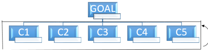
شکل ۱- مدل مفهومی پژوهش (ANP)